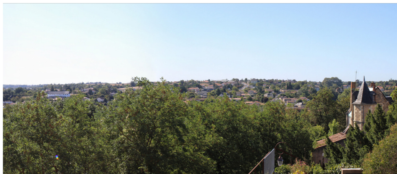
Photographie de l'état initial à 50°